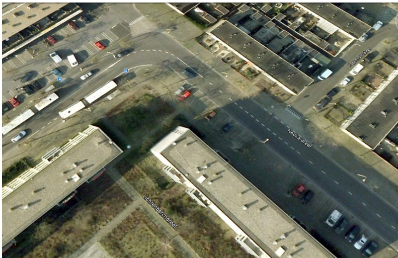
Neckardreef (lopend van rechtsonder schuin naar boven) en hoek met Theemsdreef. Veel verkeer en geen voorziening voor de fiets.